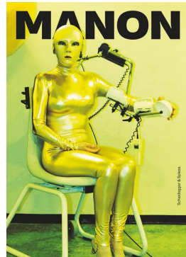
«Selbstporträt in Gold» auf dem Cover Manons neuer Monografie .